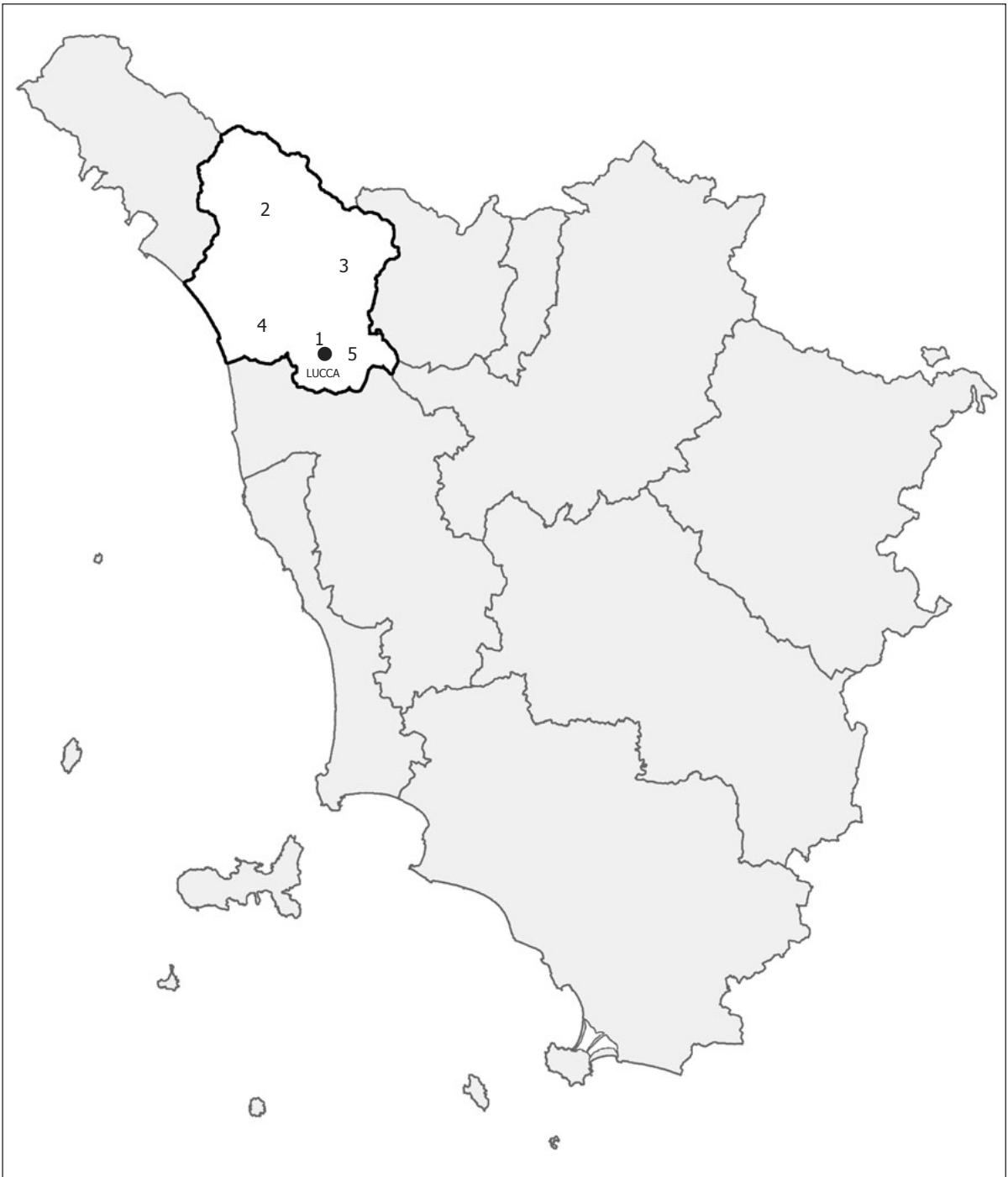
Provincia di Lucca – 1. Lucca; 2. Camporgiano; 3. Bagni di Lucca, Benabbio; 4. Camaiore, Montecatrese; 5. Capannori, via Martiri Lunatesi; Capannori, località Frizzone.