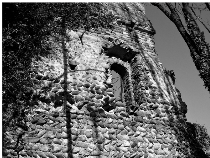
Fig. 4. Fortificazioni di Rado (Gattinara): dettaglio della muratura in ciottoli fluviali della torre.

benedettino femminile attestato dai primi decenni del XII secolo: qui si può ricordare la presenza, nelle fasce inferiori dei muri che costituiscono, in particolare, il corpo di fabbrica orientale – dei quattro, disposti intorno ad una corte centrale, in cui si articola il complesso quattrocentesco attualmente visibile – di brani di muratura realizzati interamente in soli ciottoli disposti a spina pesce ed organizzati in maniera ordinata e regolare, verosimilmente pertinenti alle fasi originarie della fortificazione del cenobio (ARDIZIO, DESTEFANIS 2014, pp. 687-726).