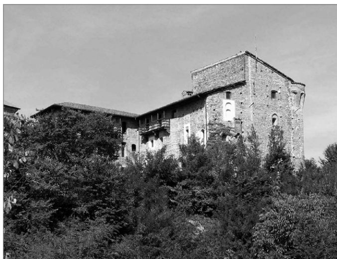
Fig. 2. Il castello di Castelletto Cervo.

sul margine del terrazzo alluvionale prospiciente la confluenza del torrente Ostola nel Cervo – la villa , a partire dal 1254 connotata dalla fondazione di un borgofranco ad opera del Comune di Vercelli, ed il castello, entrambi collocati sul margine estremo del terrazzo alluvionale prospiciente il Cervo, a monte dell'Ostola e in posizione opposta rispetto al nucleo monastico 4 .