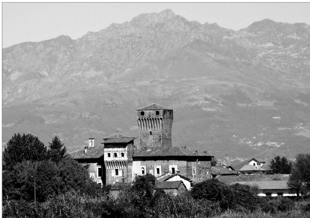
Fig. 3. Il castello di Balocco.

Questa emergenza presenta significativi punti di contatto con la torre nel complesso delle Castelle, sito sulle prime alture che circondano Gattinara, articolato in due recinti fortificati che occupano le sommità, seguendone i contorni, di due colline, separate tra loro da una sorta di pianoro lungo circa un centinaio di metri, interessato in epoca medievale dalla chiesa di San Giovanni Evangelista (FERRETTI, REFFO 1990; SOMMO 1991, pp. 73-75). Il recinto nord è caratterizzato da una tessitura muraria in soli ciottoli fluviali, posati sia a spina-pesce che in corsi regolari comprendenti bozzette lavorate a spacco, a tratti nascosta da rifacimenti posteriori che includono inserti laterizi. Il secondo recinto, quello a sud, presenta forma e struttura muraria pressoché analoga, ma al suo interno è collocata una torre a pianta quadrata (con lato di circa 7 m), realizzata, nella sua porzione basale più antica, in ciottoli posati a spina di pesce con cantonali in blocchi lapidei – alcuni dei quali caratterizzati da dimensioni notevoli, anche oltre il metro di lunghezza – accuratamente squadri e connessi. Spiccano alcuni elementi verosimilmente di reimpiego, riconducibili a litotipi (ad esempio gneiss ) non reperibili localmente.