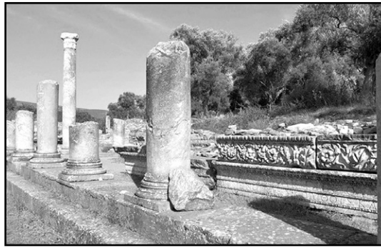
Iasos, elementi architettonici della stoà orientale dell'agorà.

S eppure in forma abbreviata rispetto al passato (ovvero senza entrare nel merito dei lavori), ecco l'elenco delle pubblicazioni che, nel triennio 2016-2018, hanno trattato temi e argomenti riguardanti Iasos.