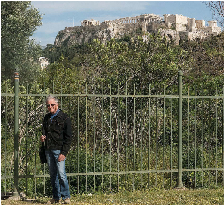
2. Atene 2017.

presentato i risultati delle ricerche al tempo in cui siamo stati allievi della Scuola che, per un curioso destino, venne a coincidere con anni contigui (io nel 1969-70 e 1973, lui nel 1972), ricerche entrambe indirizzate su contesti molto vicini l'uno all'altro all'interno dell'agorà romana. Di tale convegno rimane anche la foto che lo riprende nel ruolo di moderatore durante la discussione a conclusione dei lavori ( Blasos 17, 2011, p. 49, fig. 4).