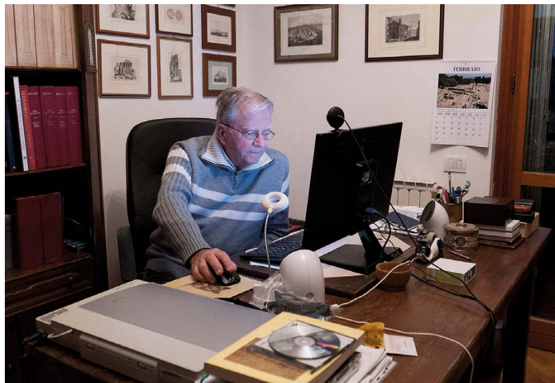
1. Al lavoro a Firenze.